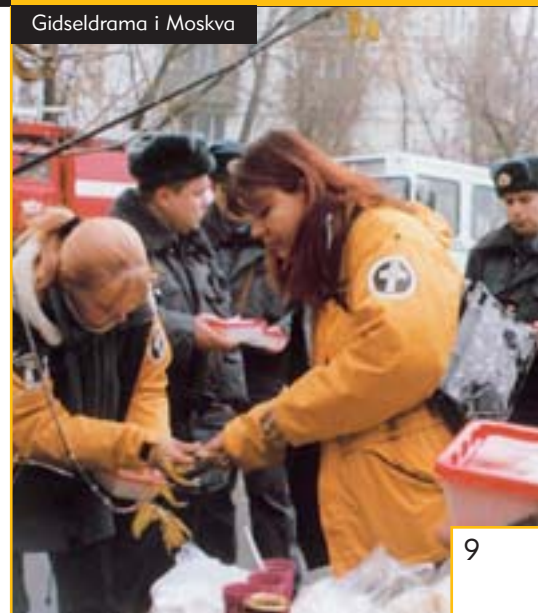
Gidseldrama i Moskva

naturligvis i voldsomme fysiske og følelsesmæssige traumer. Kendskabet til de Frivillige Hjælperes indsats i Moskva havde bredt sig, og nødberedskabet i St. Petersburg henvendte sig til deres lokale Frivillige Hjælpere og bad om hjælp. Resultatet var, at inden for en time var Frivillige Hjælpere i gang med at give assister til de mange katastrofeofre. De arbejdede