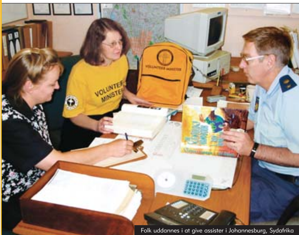
Folk uddannes i at give assister i Johannesburg, Sydafrika

D en 28. maj 1995 blev øen Sakhalin ved Ruslands Stillehavskyst ramt af et jordskælv med en styrke på 7,6 på Richterskalaen. Den nordlige by Neftegorsk endte næsten fuldstændigt i ruiner. Overlevelsesprocenten var