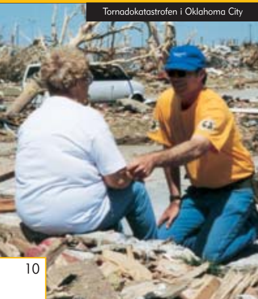
Tornadokatastrofen i Oklahoma City

natten igennem og hjalp nødhjælpsarbejderne med at dæmpe forvirringen og hjalp dem, der havde mistet deres hjem, med at få tag over hovedet.