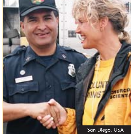
San Diego, USA

Frivillige Hjælpere fra Scientologi Kirken hjalp brandmænd og ofre under skovbrandene i det sydlige Californien i 2003 i tusindvis af timer. De blev rost for deres indsats af embedsmænd fra forbundsregeringen og fra staten Californien, herunder San Diegos borgmester og Californiens guvernør.