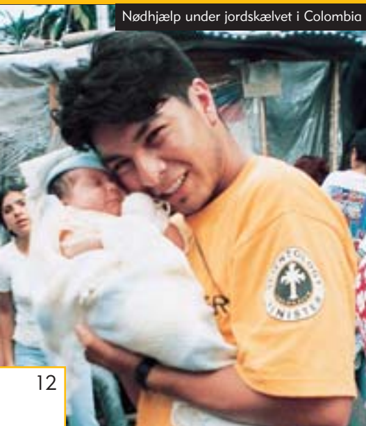
Nødhjælp under jordskælvet i Colombia