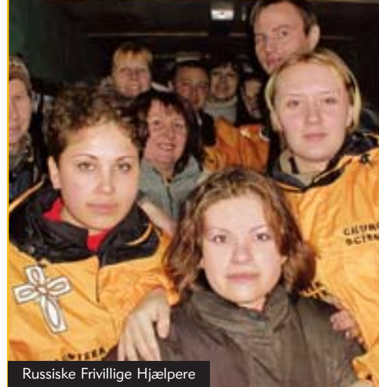
Russiske Frivillige Hjælpere

Flere tusinde kvinder, børn og gamle, som afventer afslutningen på krigen i Tjetjeniens teltbyer i Ingusjetien, er i en vanskelige situation. Den er blevet lettet noget gennem forskellige hold fra de russiske Scientologi Kirkers Frivillige Hjælperes ophold i lejrene – bl.a. beroliger de beboerne, og giver dem mod og nyt håb.