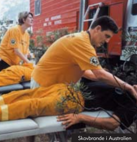
Skovbrande i Australien

Frivillige Hjælpere fra Scientologi Kirken arbejdede side om side med brandmænd i kampen mod de skovbrande, der brændte 4.8 mio. hektar skov af i Australien. Toppen hos brandvæsenet bad de Frivillige Hjælpere, der gav disse linderende assistenter, om at uddanne deres egne folk i fremgangsmåderne. Da et jordskælv i Colombia resulterede i 10.000 hjemløse, gav flere forskellige grupper af Frivillige Hjælpere åndelig hjælp til de traumatiserede og hjalp med at organisere uddelingen af vand og proviant (nederst).