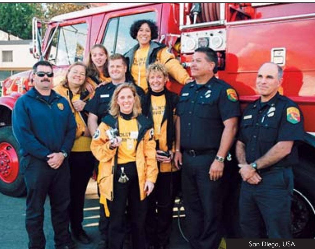
San Diego, USA

“Det er langt den mest professionelle og engagerede frivillige gruppe, jeg nogensinde har set.”