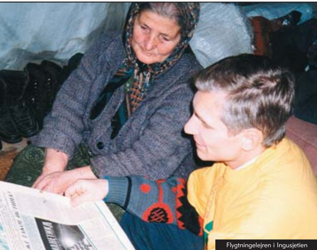
Flygtningelejren i Ingusjetien